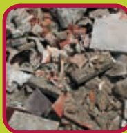
steen-en betonpuin 0,02 euro/kg