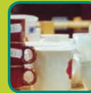
herbruikbare goederen ook fietsen en fietsonderdelen