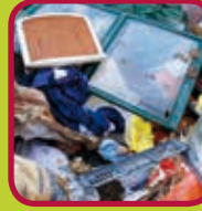
grof vuil 0,24 euro/kg