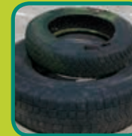
autobanden max. 4 stuks per aanlevering