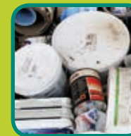
Klein Gevaarlijk Afval (KGA) verplicht melden aan de recyclagepark- wachter