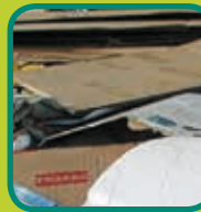
papier en karton dozen leegmaken en open vouwen