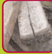
C-hout geïmpregneerd hout of behandeld met carboline 0,15 euro/kg