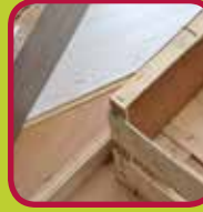
B-hout gelijmd of samengesteld hout 0,10 euro/kg