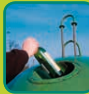
glazen flessen en borden ontdaan van etensresten