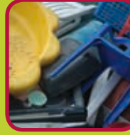
harde kunststoffen 0,10 euro/kg