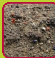
zand 0,02 euro/kg