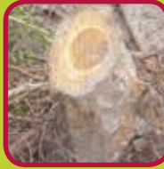
boomstronken zonder aarde 0,10 euro/kg