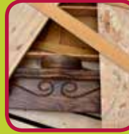
A-hout zuiver massief hout 0,10 euro/kg