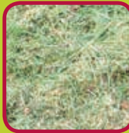
gras 0,10 euro/kg