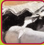
hechtgebonden asbest verpakt in doorzichtig plastic bouwfolie van min. 0,10 mm dikte 200 kg/jaar/gezin: gratis >200 kg/jaar/gezin: 0,24 euro/kg