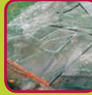
vlak glas 0,10 euro/kg