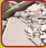
kalk, gipsplaten en cellenbeton 0,15 euro/kg