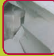
piepschuim wit en zuiver <60 liter: gratis 60-200 liter: 1 euro >200 liter: 6,50 euro