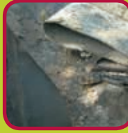
roofing 0,15 euro/kg