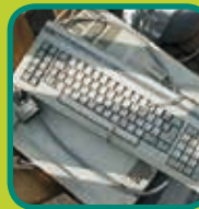
AEEA Afgedankte Elektrische en Elektronische Apparaten