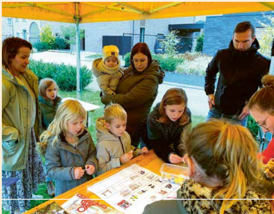
Participatiemoment speelterrein Hemelrijk (Veerle).

Ook in 2024 zullen we weer enkele speelterreinen onder handen nemen. Op die manier creëren we ontmoetingsplekken waar kinderen en jongeren kunnen samenkomen.