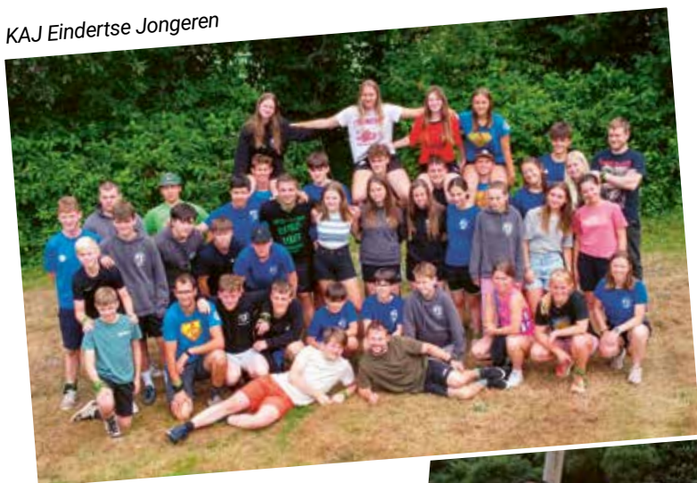
KAJ Eindertse Jongeren

September betekent niet enkel de start van het nieuwe schooljaar, maar ook heel wat verenigingen starten hun nieuw werkingsjaar op. Wist je dat je bij de meeste verenigingen enkele keren kan 'proberen' vooraleer je je moet inschrijven? Een overzicht van de erkende Laakdalse verenigingen vind je op www.laakdal.be/verenigingen .