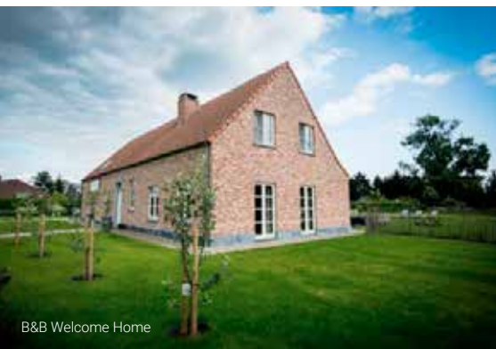
B&B Welcome Home

Grote, jaarlijkse rommelmarkt Eerste zaterdag van augustus KLJ Veerle-Heide, omgeving Zandstraat, Veerle-Heide.