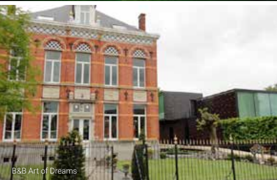
B&B Art of Dreams