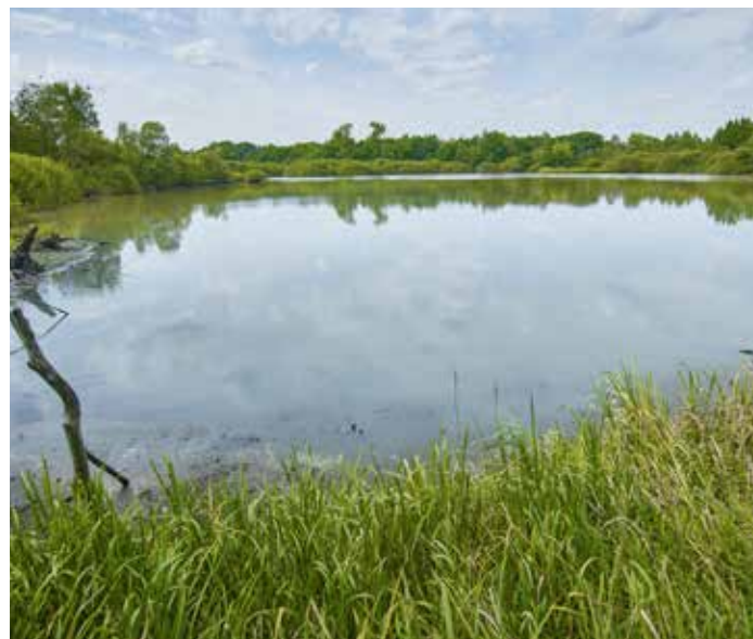
Grote waterplas met kijkhut in Trichelbroek

Meer info: www.demerodeonline.be/locatie/ruiteren-in-de-merode/